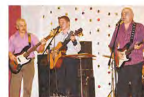
В исполнении «Джентльменов»