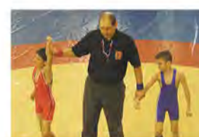
Вольная борьба: область