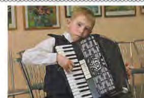
Культура для культуры