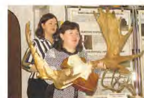
Экспонаты руками трогать