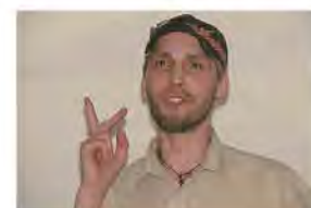
«Кругосветка» через Сирию