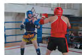
Кубок Федерации по «тайскому»