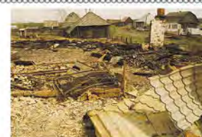
Весна, ветер и пожар