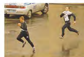
Бежали в 61 раз