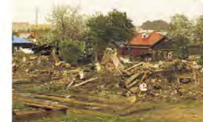
Старый город с продолжением