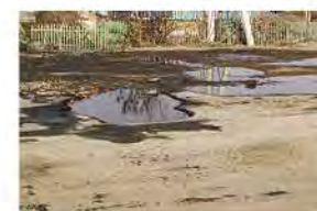
Прокуратура указала на дорожные ямы