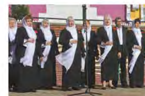
В единый хор сливались голоса...