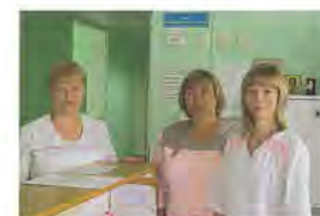
90-летний опыт в медицине