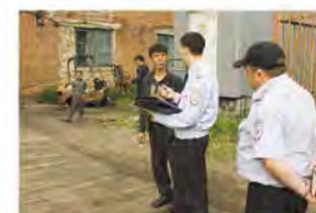
Зачем в Россию приехал?