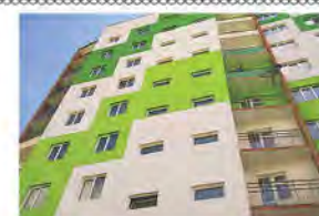
Три дома на Восточном