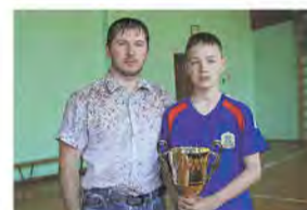
Проторили дорогу в «Орлёнок»