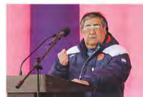
Он 20 лет возглавляет регион