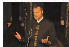
Слова и музыка о вечном