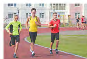
Эстафетный бег в Кемерове с. 4