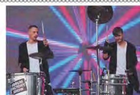
Зажигали нефтяники с. 2