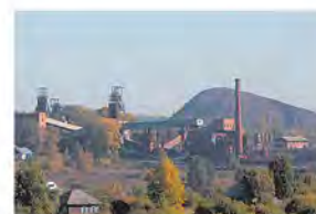
Терриконы тоже не вечны с. 3