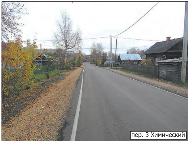
пер. 3 Химический