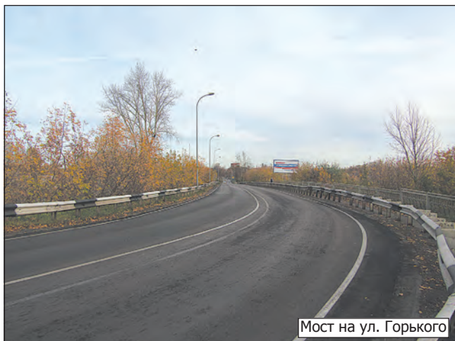
Мост на ул. Горького

Ну, а для тех наших читателей, кто ещё не имеет представления о положительных переменах в разных районах города, наш фотокорреспондент Иван Владимиров подготовил специальный репортаж.