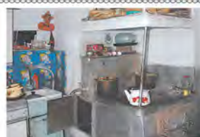
Мечта о тёплом доме

В воскресенье на масленичные гулянья пришло множество горожан. Традиционные игры в народном стиле, песни и пляски - праздник порадовал.