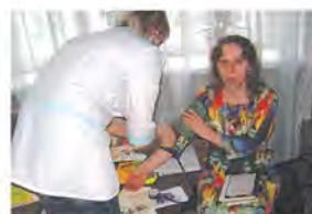
Здоровому - о здоровье