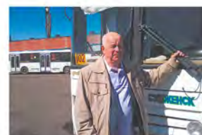
Полвека за рулём