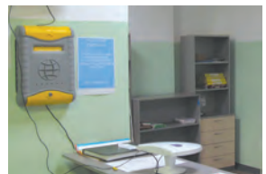
Ящик для писем от пациентов