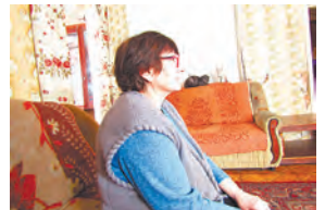
Внуков отправили в детдом