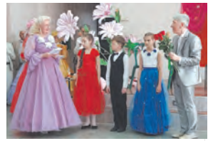
На бал во дворец культуры...