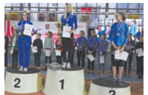
Столичный кубок легкоатлетки