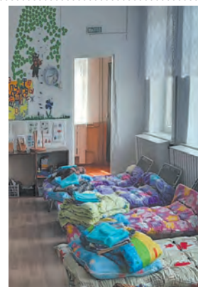
Помогли семьям погорельцев