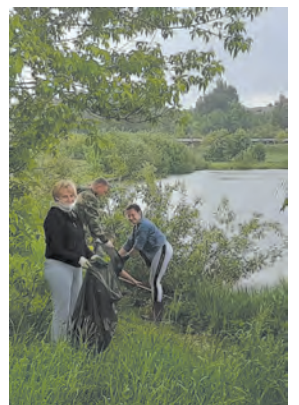
Бизнес наводит чистоту