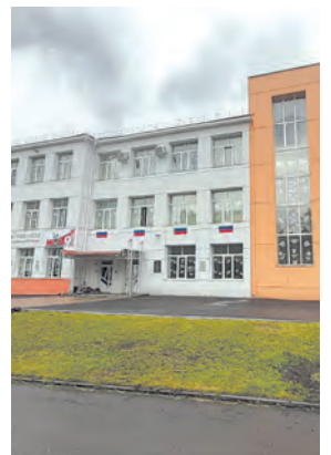
Гимназия в топе лучших