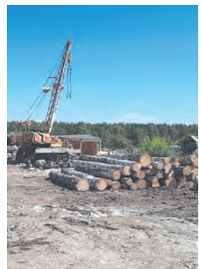
В обход уличных проблем