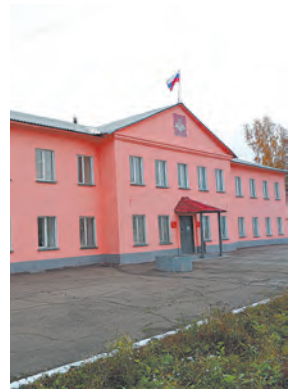
Призыв в условиях пандемии

В связи с плановыми ремонтными работами, вода в город и посёлок Рудничный не будет подаваться с 6.00 28 июля до 6.00 29 июля. На верхние этажи в домах стекольного района, восьмой горы и третьей шахты вода будет поступать с некоторым опозданием. Рекомендовано в течение суток после возобновления подачи употреблять воду в питьевых целях после предварительного 30-минутного отстаивания и кипячения.