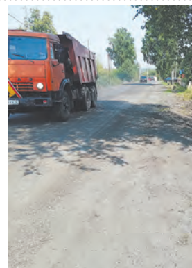
Ждем капитального преобразования