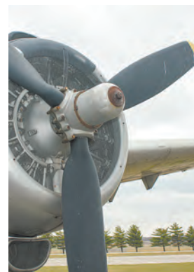
16 августа - День авиатора