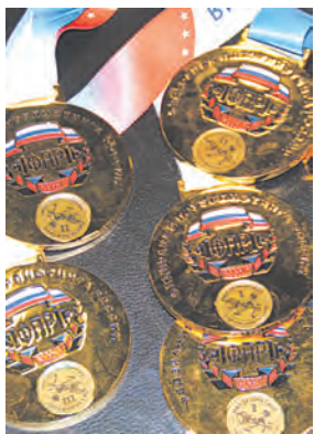
Из Кедровки с медалями с. 3