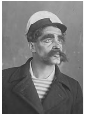
История ДК в рассказах очевидицы с. 2