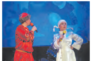
Мюзикл в условиях ДК

Анжеросудженцев не остановила пандемия, и более 1000 человек совершили обряд омовения в крещенской воде. За ситуацией следили спасатели и медики. Православное праздничное событие подробно описал наш корреспондент.