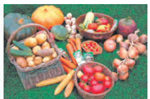
Дело - к весне! Изучаем лунный календарь