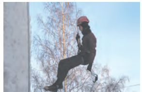
Покорение анжерской «Высоты»