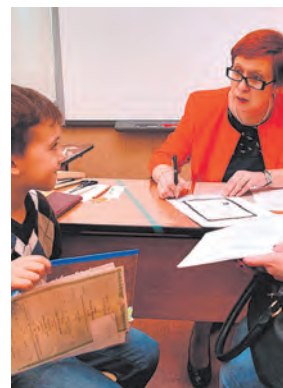
Записываем ребенка в школу