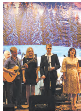
Высоцкий - песня моя