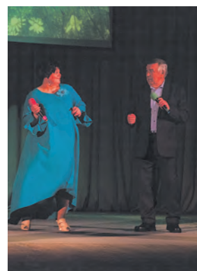
10 лет на сцене ДК