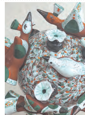
Вечный круг гончарный