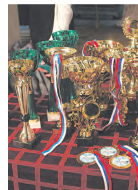
Штанга на «дворцовой» сцене