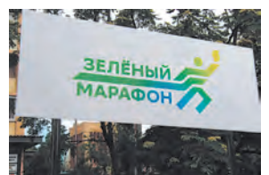
ЗОЖ плюс экология