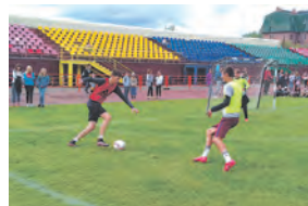
Впереди - финал