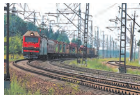
Трагедия на путях