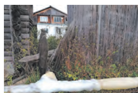
Трубы не остынут