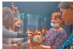
Красота из глины