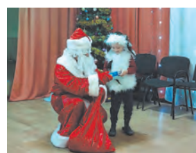
Добрый, но строгий