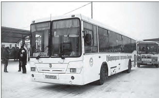
А. Витина, фото из архива «РЧО»

Напомним, ранее представители регионально-го Минтранса заявляли, что себестоимость проезда одного пассажира на сегодня составляет 40 рублей и что предприятия нуждаются в повышении цен на проезд. Но при этом Минтранс сообщал о том, что решения по повышению стоимости проезда не принято.