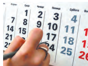
Труд и отдых