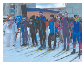
Снеговики-лыжники в Рудничном