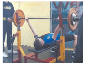
Молодые и сильные