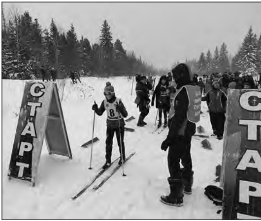
В рамках региональных соревнований прошло первенство АСГО.