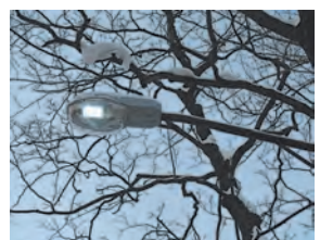
Улица станет светлой